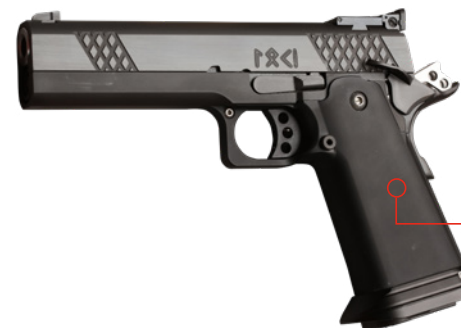
● STANDARD DIVISION

Der Major Power Factor liegt bei mindestens 170, der Minor Power Factor bei 125 Faktoren. Das Minimalkaliber für die hinsichtlich der Punkteausbeute vorteilhafte Major-Wertung beträgt 10 mm (.40“), weshalb die Patrone .40 S&W das Maß der Dinge ist.