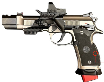
● OPEN DIVISION

Als Minimum bei Geschosskaliber, Hülsenlänge und Geschossgewicht gilt 9 mm, 19 mm und 120 Grain, so dass hier typische Kaliber 9 mm Luger (9x19), 9x21 IMI, .38 Super Auto, .38 Super Comp, .38 Super Rimless oder 9x23 Winchester sind.