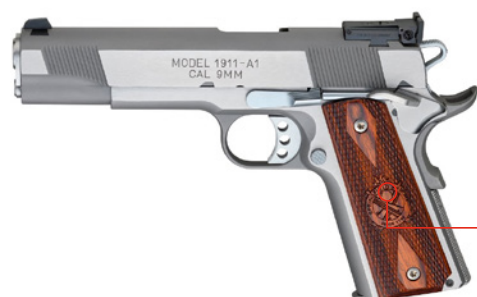
● CLASSIC DIVISION