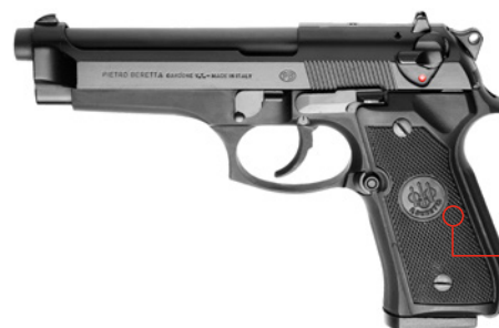
● PRODUCTION DIVISION

Unabhängig von der originalen Magazinkapazität dürfen nur 15 Patronen geladen werden. Geringfügige Modifikationen sind erlaubt. Alle zugelassenen Waffen werden auf der stets aktualisierten „IPSC Production Division List“ aufgeführt (siehe: www.ipsc.org ).