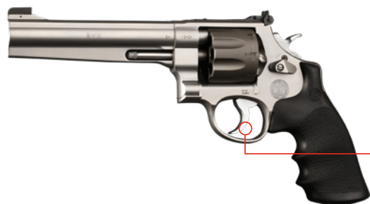
● REVOLVER DIVISION

Gerne werden auch hier Revolver in Pistolenkalibern 9 mm Luger und .45 ACP eingesetzt, weil sie mit halbmond- oder vollmondförmigen Blechclips besonders schnell mit frischen Patronen versorgt werden können. Es ist nur die mechanische Visierung erlaubt und es besteht keine Begrenzung bezüglich der Trommelkapazität.