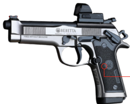
● PRODUCTION OPTICS DIVISION