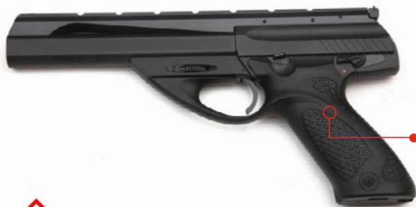
STANDARD RIFIFIRE PISTOL DIVISION

Mit „Kimme und Korn“ wird in dieser Klasse sportlich-fair um Punkte gekämpft. Auch in den beiden „Mini Rifle“-Disziplinen beträgt die Magazin-kapazität maximal 10 Patronen.